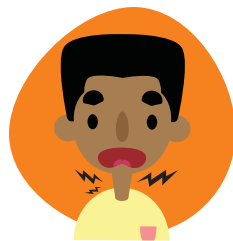
Dificultad para tragar