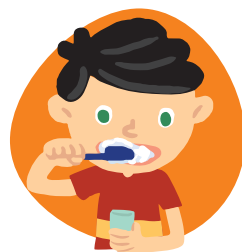
Dificultad para hacer actividades cotidianas como vestirse o bañarse