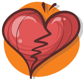
Problemas en el corazón

Si usted es un sobreviviente de sepsis, es decir de una, infección grave, esté atento a los signos y síntomas: