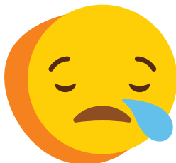
Depresión, tristeza y dificultad para poner atención